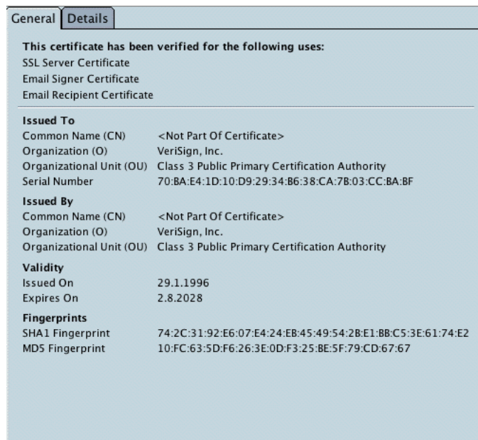
Abbildung 3.3: Zertifikatsdetails Verisign

Mit ca. 400$ für das Erstellen und knapp 150$ pro Jahr für die Erneuerung ist Verisign 7 die teuerste Zertifizierungsinstantz. Einfacher und günstiger ist es in der Regel, kleine Zertifizierungsinstantzen - z.B. Comodo 8 , RapidSSL 60.- Fr/Jahr oder GeoTrust - anzugehen bzw. selber eine Zertifizierungsinstantz aufzubauen und zu betreiben.