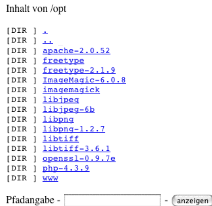
Abbildung 4.3: Directory Listing sample

Ist diese Option nicht gesetzt, kann PHP auf alle Verzeichnisse und Dateien zugreifen, welche für den Apache Serviceaccount zugänglich sind.