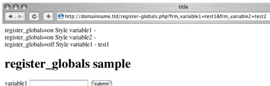
Abbildung 4.5: register_globals=off

Deaktiviert man die Option und testet den Beispielcode erneut, wird nur noch die sauber codierte Variable variable1 initialisiert und mit dem Parameterwert gefüllt.